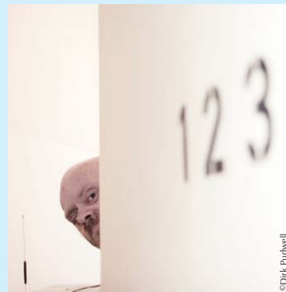
Pik As: Hilfe für Obdachlose